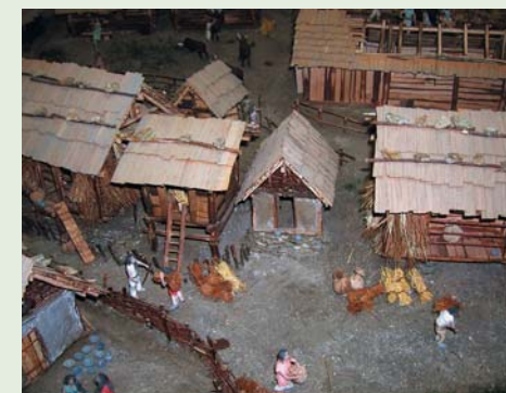
Gamsen Waldmatte(VS) (Age du fer) Echelle 1/50