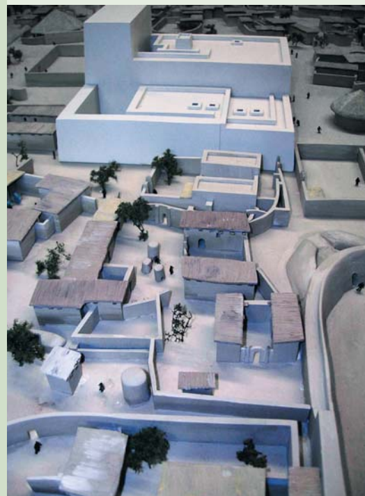
Ville de Kerma classique (Soudan) 1'900 - 1'700 av. J.-C. Echelle 1/300

Si les réalisations de Hugo Lienhard vous intéressent, vous pouvez prendre rendez-vous avec lui au 022 755 34 90.