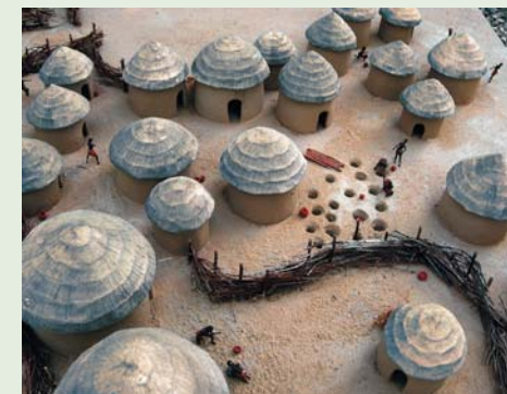
Pré Kerma (3'200 - 2'500 av. J.-C.) Echelle 1/100

Si les réalisations de Hugo Lienhard vous intéressent, vous pouvez prendre rendez-vous avec lui au 022 755 34 90.