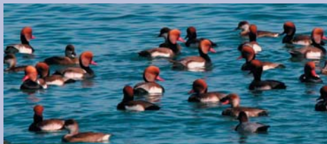
La nette rousse plonge pour se nourrir d'élodée, une algue poussant dans les eaux peu profondes.

Le Creux de Mies est alors un lieu de ballets d'envols et d'atterrissages, de plongées et de séances de recherche de nourriture. Parmi les espèces emblématiques, la nette rousse, canard plongeur se nourrissant principalement d'une algue, l'élodée, et dont plus de 2'500 individus ont été recensés. Le milouin dont certains sujets viennent depuis l'Oural, est également très présent avec un maximum de 3'800 représentants.