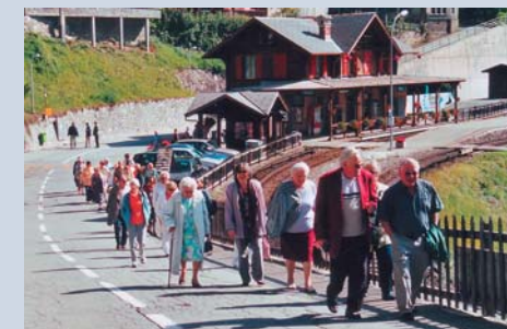
Sortie au Lac Vert, le 16 septembre 2005