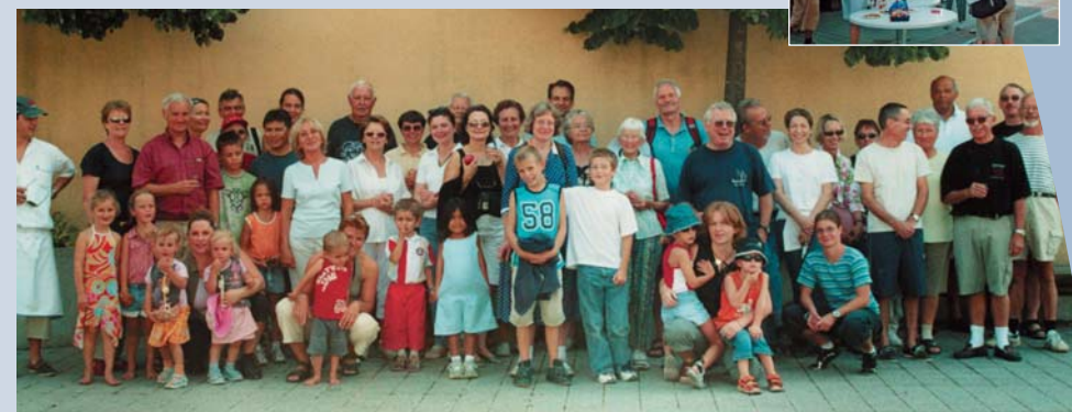
Promenade à la découverte de Mies, le 3 septembre 2005