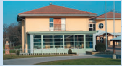
La nouvelle véranda Au Sorbier

Pour toute information, le 022 779 11 67 ou 079 824 56 64 saura vous renseigner concernant le fonctionnement et les tarifs de la structure. Les animateurs profitent de lancer un appel aux Myarolans qui auraient des déguisements et/ou coussins en bon état à offrir à la Grotte aux Enfants- Merci d'avance. PM