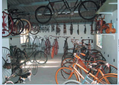
La collection des vieux vélos – un beau but de balade

Un apéritif offert par la Commune et un repas ont terminé agréablement cette matinée. FG